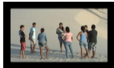
FIGURA 2 - Jovens da comunidade dos Tatus em Ilha Grande/PI, mobilizados em torno da problemática socioambiental

A capacitação teve finalização com a criação de um núcleo juvenil de consciência ambiental em Tatus; os jovens se tornaram multiplicadores ambientais para o resto da comunidade, inclusive colaboraram na realização do documentário “Onda Branca”, colocando em prática a aprendizagem adquirida ao longo das oficinas.