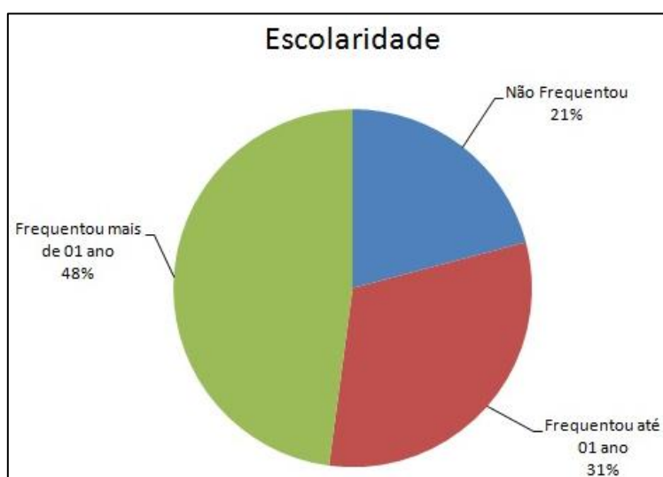
Gráfico 1 – Escolaridade dos alunos do Projeto MOVA-Brasil, 2013.